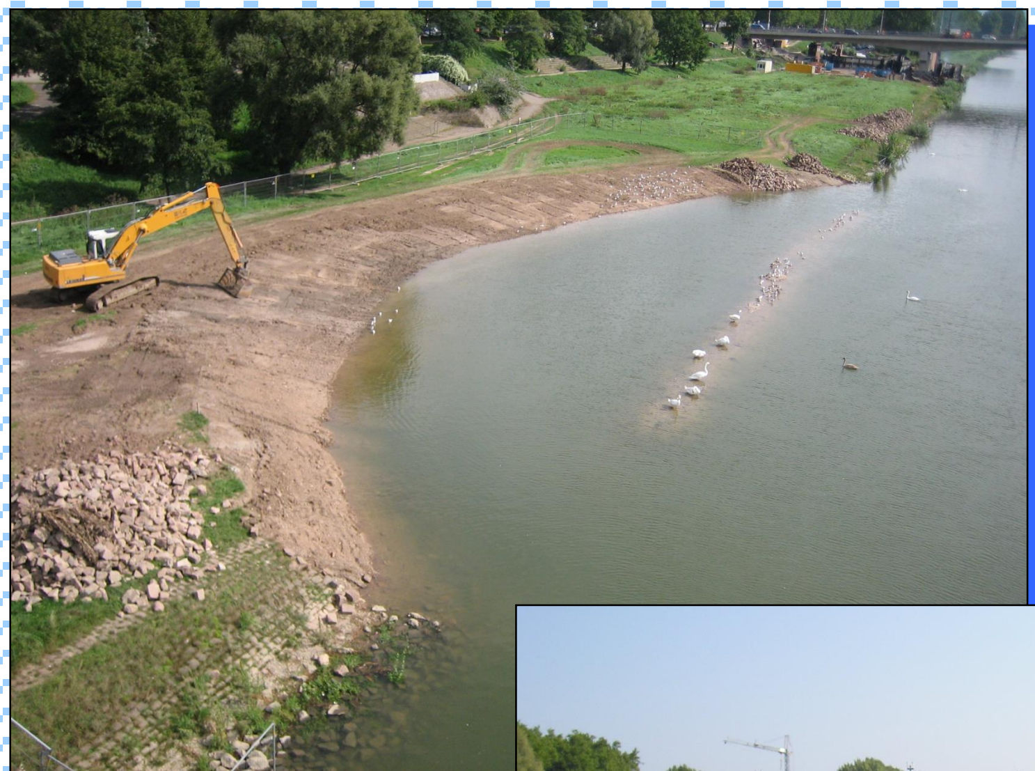
Flachwasserzone in Mannheim