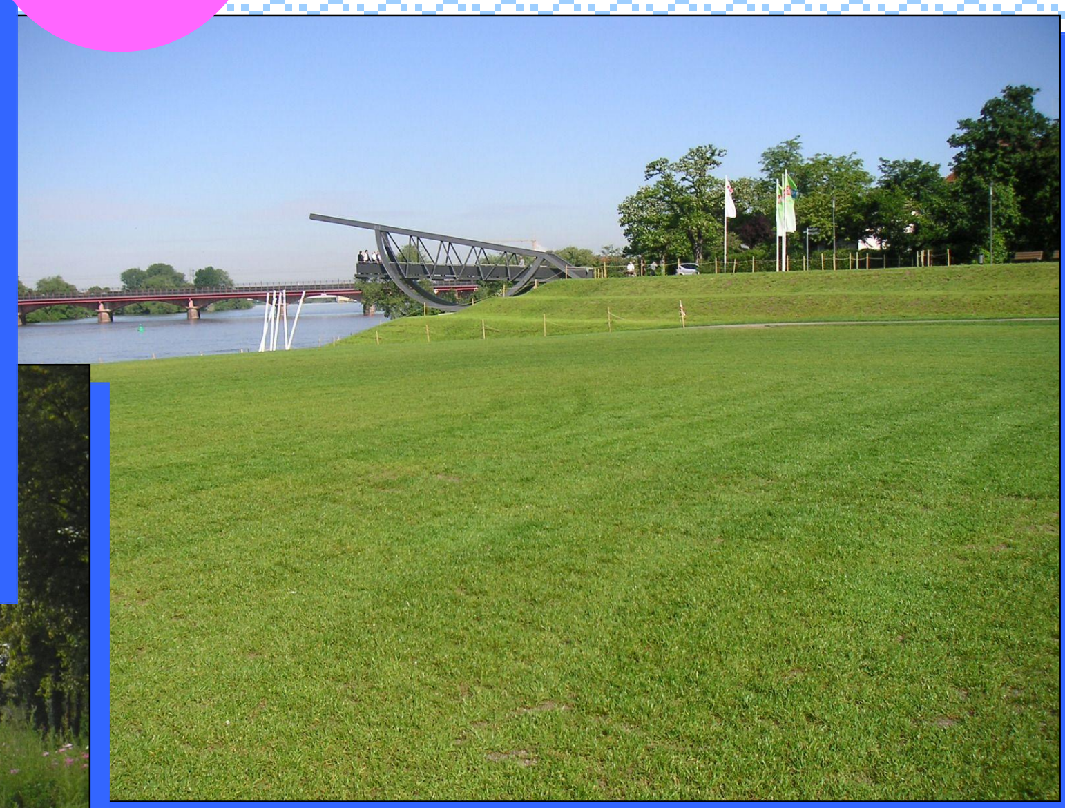
Durchgängige Fuß- und Radwegführung am Neckarufer in Ladenburg