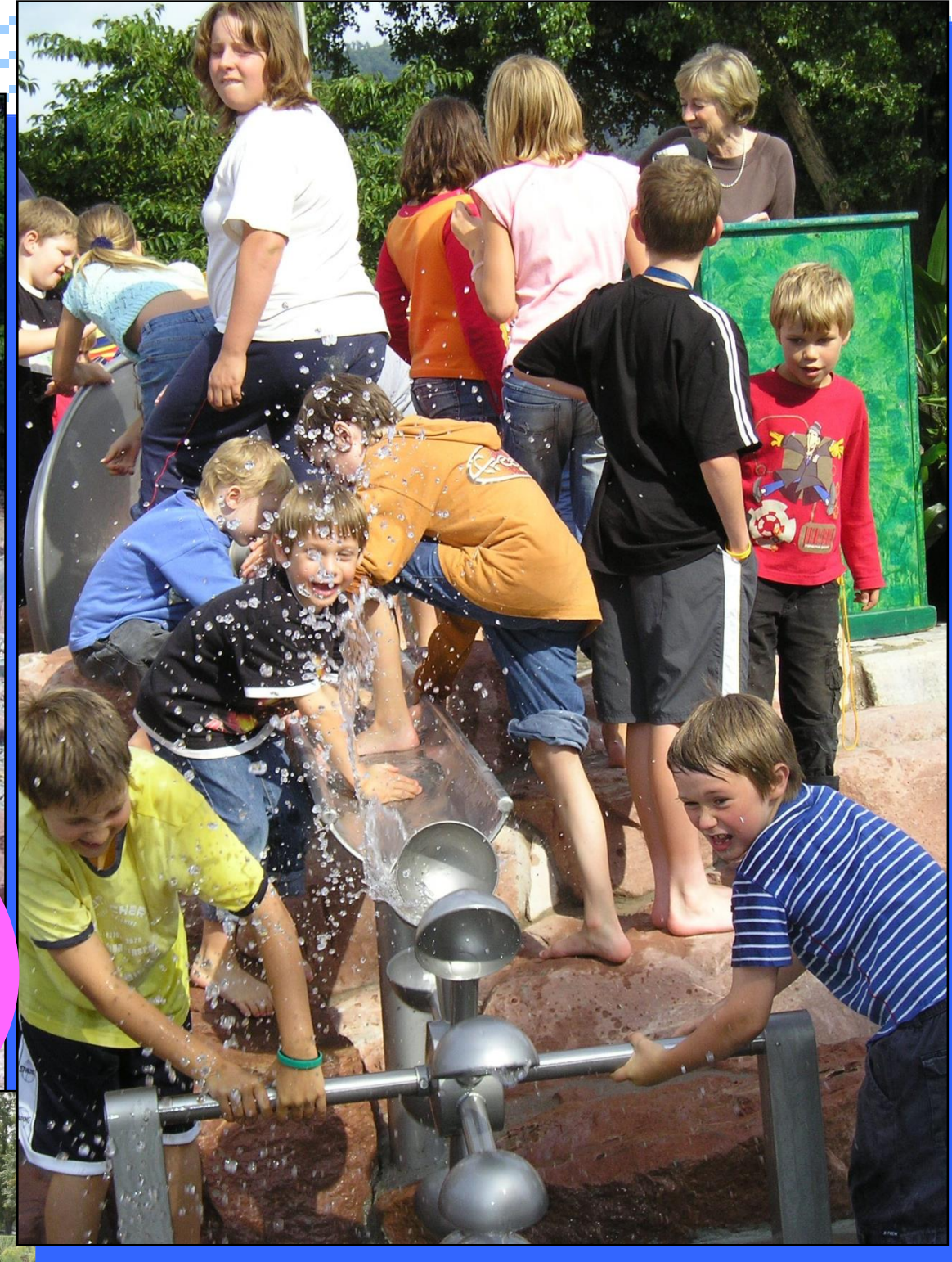
Der Wasserspielplatz in Heidelberg