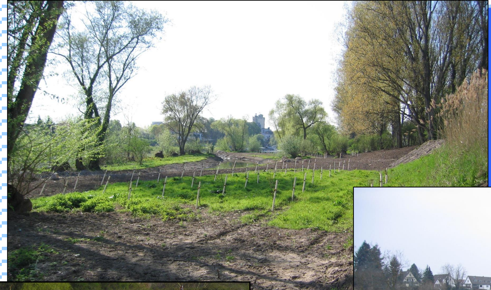
Schwabenheimer Schlut in Dossenheim